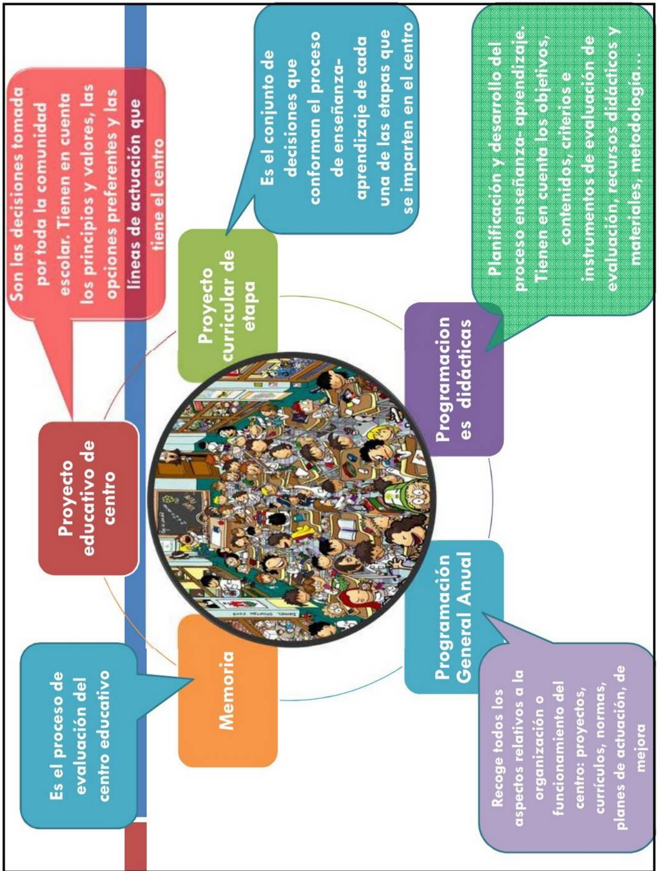
Imagen de Lourdes Alcalá