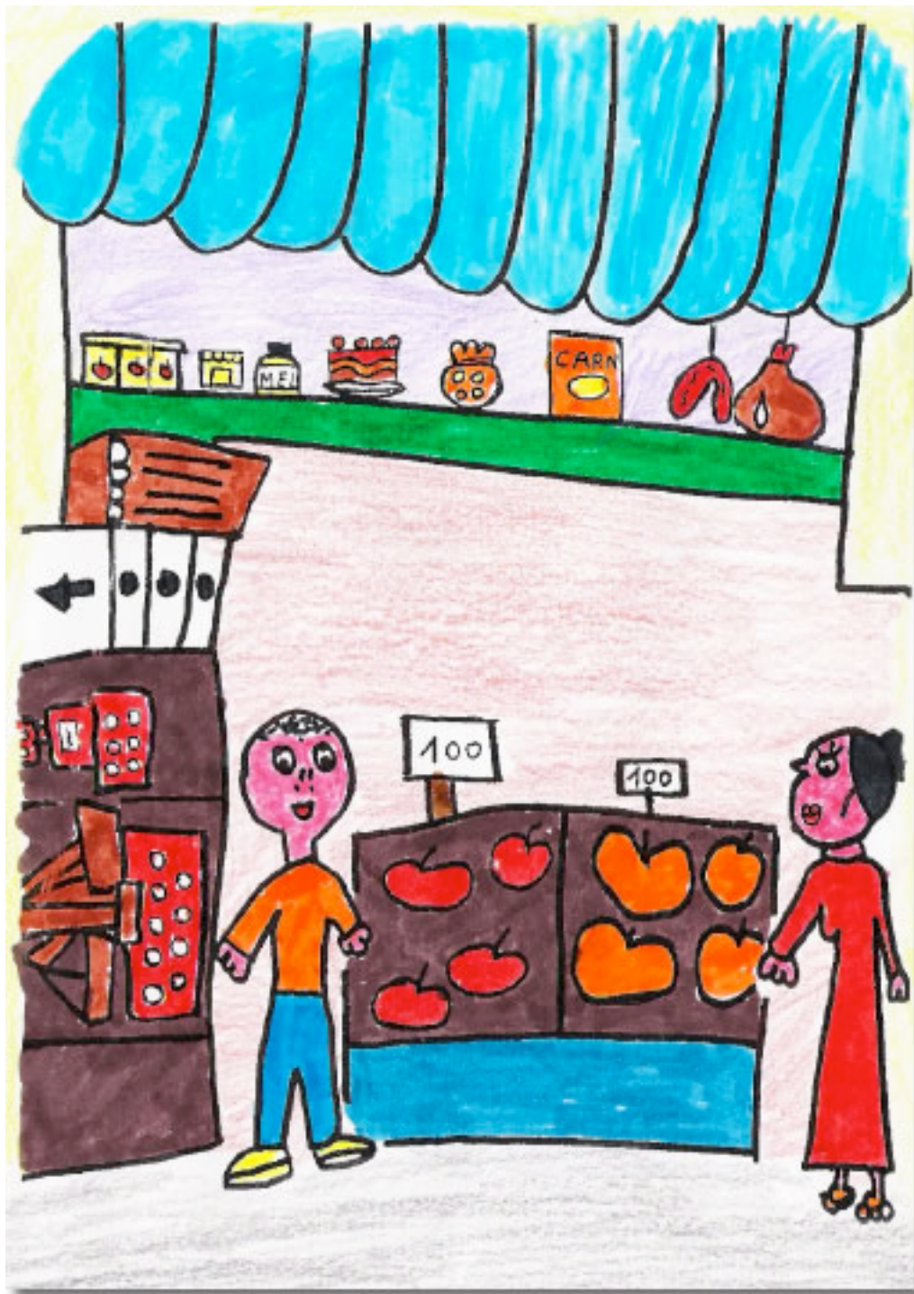
CUAN VA ARRIBÁ A LA TIENDETA VA VERE UNES COSES REDONES MOL GORDES.